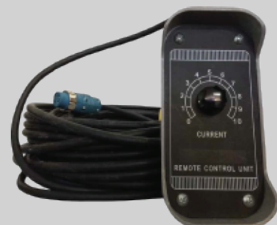
CONTROLE REMOTO (OPCIONAL)